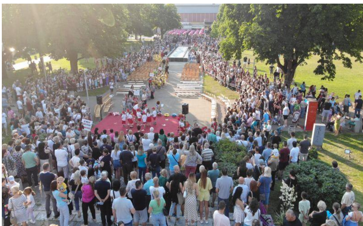
У дефилеу „На крилима маште“ учествовала су сва дјеца наше установе шетњом градом и програмом у Градском парку.