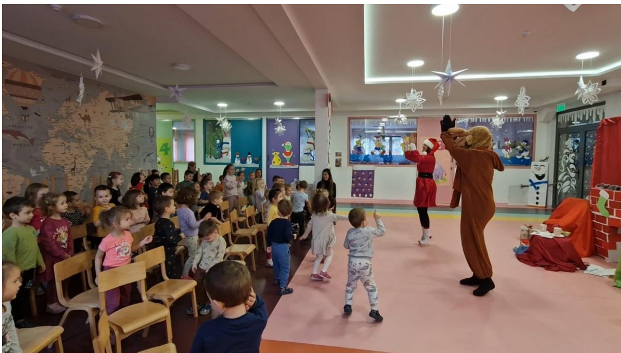
Новогодишњу приредбу „С Дједа Мразом око свијета“ организовали смо у нашој установи