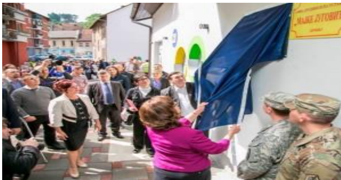
Објект Установе у ул.Војводе Мишића

Организациона јединица – Дјечији вртић у Ул. Војводе Мишића бб - Стари Град посједује 5 радних соба и кухињу.