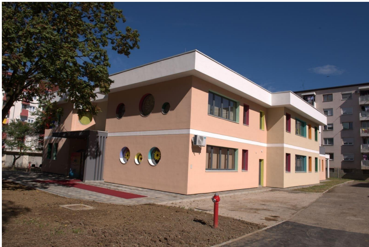
Објекат Установе у ул. Краља Петра I бр.23

Организациона јединица – Дјечији вртић у ул. Краља Петра I бр.23, основана је на основу Одлуке о измјени и допуни Одлуке о усклађивању организације и рада Јавне предшколске установе „Мајке Југовић“ Добој, Скупштине града Добоја број: 01-013-261/22 од 11.10.2022.године и Одлуке о оснивању организационе јединице установе – Дјечијег вртића у ул. Краља Петра I бр.23 у саставу ЈПУ „Мајке Југовић“ Добој, Управног одбора установе, број: 1161/2022 од 03.11.2022.године. Почео је са радом 01.02.2023.године и посједује седам радних соба, терасу, двориште, трпезарију и кухињу.