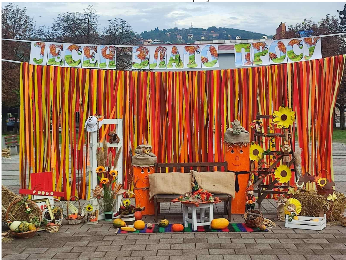
Јесен злато просу