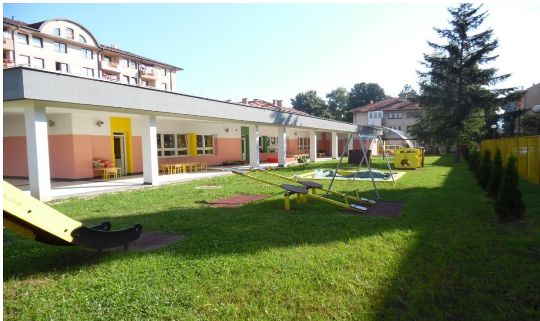
Објект Установе у ул.Кнеза Лазара

Организациона јединица – Дјечији вртић у Ул. кнеза Лазара бб је отворен 17. 09.2012. Посједује 5 радних соба са излазом на терасу, двориште, трпезарију и кухињу.