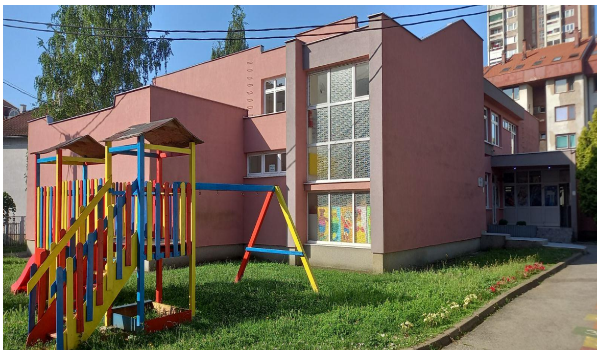
Објект Установе у ул.Карађорђева 50

Организациона јединица – Дјечији вртић - Карађорђева улица бр. 50, гдје је и сједиште установе, основан је 1980. године. Посједује 7 радних соба са излазом на терасу, двориште, трпезарију и кухињу.