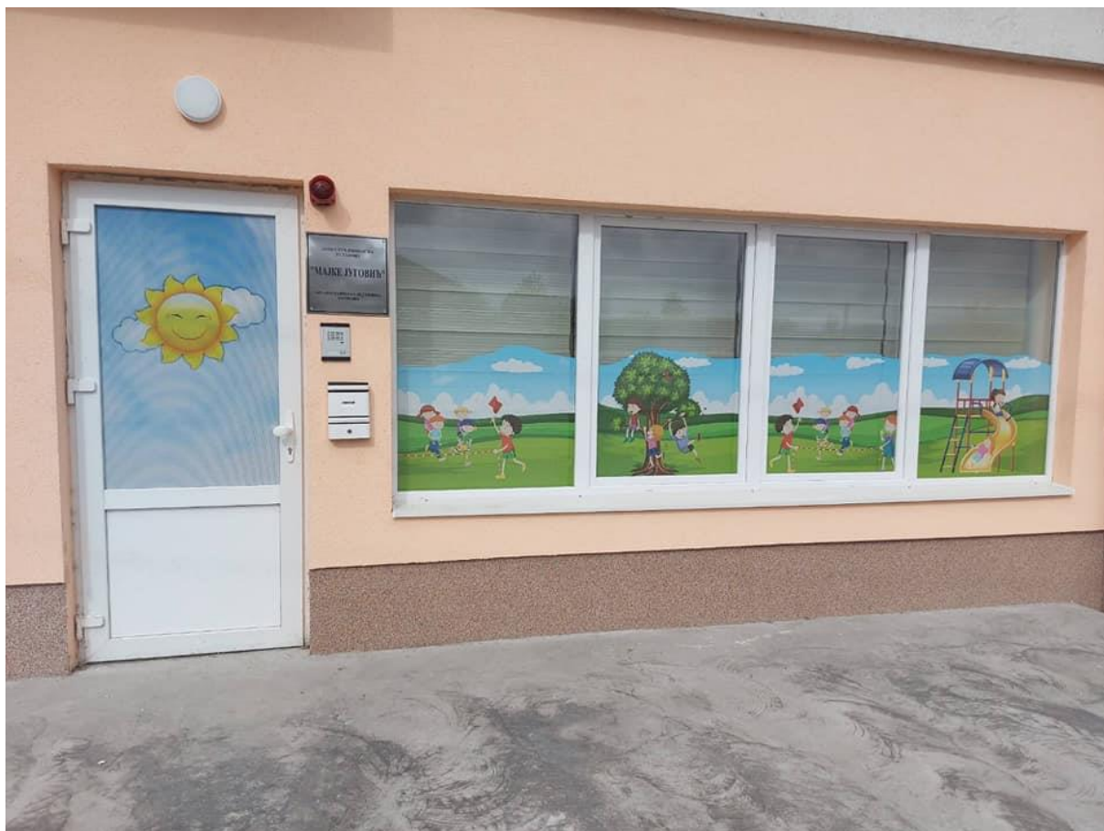
Објекат Установе у ул. Озренских одреда 60, Петрово

Организациона јединица – Дјечији вртић у ул. Озренских одреда 60, Петрово је организациона јединица установе основана на основу Одлуке о измјени и допуни Одлуке о усклађивању организације и рада Јавне предшколске установе „Мајке Југовић“ Добој, Скупштине града Добоја број: 01-013-245/21 од 25.05.2021.године и Одлуке о оснивању организационе јединице установе – Дјечијег вртића у ул.Озренских одреда 60 Петрово у саставу ЈПУ „Мајке Југовић“ Добој, Управног одбора установе, број: 298/2021 од 29.04.2021.године. Почео је са радом 01.11.2021.године и посједује двије радне собе, терасу, двориште и кухињу.